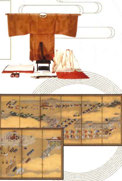
明治天皇御束帯（黄櫨染御袍）一式

この展覧会では、小原家文庫（皇學館大学佐川記念神道博物館）をはじめ、大切に伝えられてきた大札（即位礼・大嘗祭）に関する資料を、多くの皆様にご覧頂けたら幸いです。