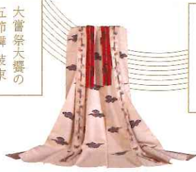
大嘗祭大嘗の 五節舞装束