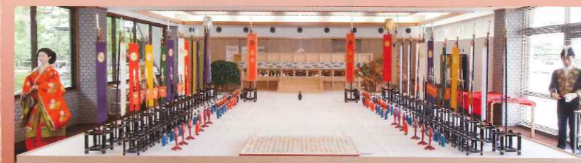
「大正即位式模型」 京都宮廷文化研究所

現代では、京都宮廷文化研究所が大型の即位式模型や実物大の装束などを制作、受け継がれてきた宮廷文化のみやびな様相をリアルに伝えます。