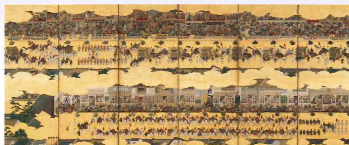
「二条城行幸図屏風」(左隻) 泉屋博古館