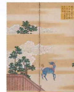
「天明度大嘗会本文御屏風」(部分) 京都国立博物館

このたび、京都国立博物館に秘蔵されていた、江戸後期の大嘗会屏風を初めて公開します。近代の「悠紀・主基地方風俗歌屏風」とは全く異なる調度としての屏風をぜひご覧ください。