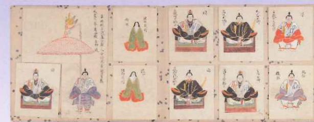
「大嘗会図」 小原家文庫(皇學館大学佐川記念神道博物館)

御代がわりに伴う御大礼(「即位式」(即位礼)と大嘗祭(だいじょうさい=即位の年の新嘗祭)は、宮廷の儀礼の中でも極めて重要かつ複雑でした。実施に携わった人々は、御大礼のための特別な建物や調度や装束、儀式的次第などを、今後に備えて子細に記録しました。ここでは御大礼にまつわる資料のほか、悠紀地方・主基地方(=大嘗祭神饌用の新穀を奉納する国郡)を決定するための卜定に使われる亀甲なども併せて展示します。