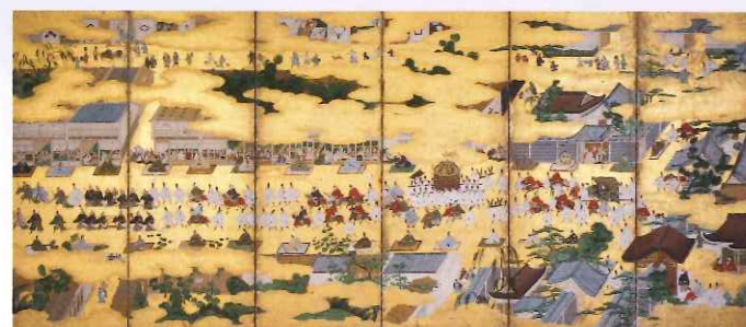
「御所参内・聚楽第行幸図屏風」(右隻) 個人蔵(上越市立歴史博物館寄託)

行幸図では、沿道を埋め尽くす見物人の姿も表情豊かに表わされています。天皇の鳳輦を心待ちにする庶民は着飾り、酒宴も開いて物見遊山の気分。天皇と庶民の意外な親近性が垣間見られます。