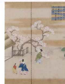
「明和度大嘗会和歌御屏風」(部分) 京都国立博物館

大嘗祭の後行われる節絵の饗宴。その会場には、悠紀主基地方から捧げられた屏風が飾られました。これらの大嘗会屏風(悠紀主基屏風)は、和歌に基づきやまと絵で描かれるものと、中国の瑞祥に因む文章(本文)が唐絵で描かれるものと2種類ありました。