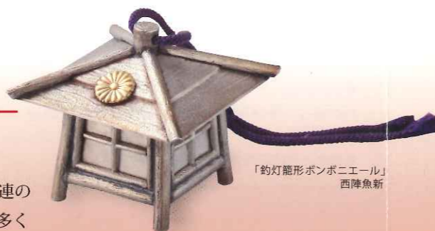
「釣籠形ボンポニエール」 西陣魚新

大正4年(1915)・昭和3年(1928)の御大礼では、一連の行事を記念する写真集や絵葉書、石版画などが数多く発行されました。それらの資料からは、御大礼の各場面はもとより、京都で開かれた記念の博覧会や奉祝の飾りが街々を彩った様子が知られます。東京の皇居から御大礼のために京都に入洛された天皇を、人々は大歓迎しました。大嘗会の饗宴(大饗)や同時に開催された宴会には多くの名士が招かれ、御大礼を奉祝しました。大饗で参加者に下賜された銀製のボンポニエール(金平糖入れ)なども展示します。