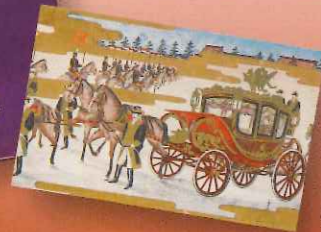
「御大礼記念」(絵葉書)